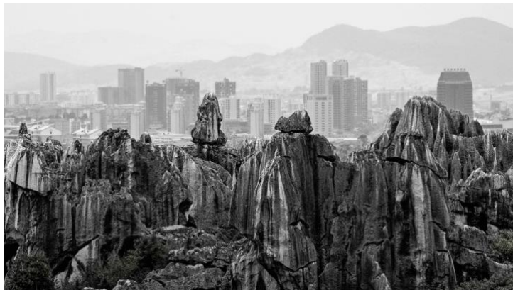
Phénomènes naturels et création humaine

La première liste de finalistes des SWPA 2019 révèle de spectaculaires images individuelles provenant du monde entier.