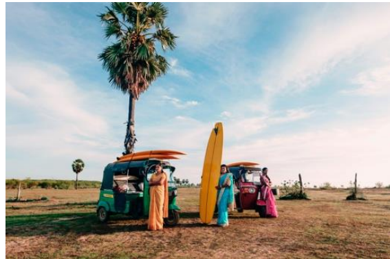
Femmes de la baie d'Arugam