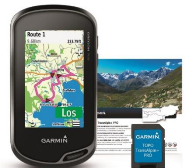
Auch als preisgünstiges Bundle mit dem Oregon 700 oder GPSMAP 64s erhältlich: Die TOPO TransAlpin+ PRO von Garmin