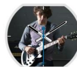
My Rock Style Forerunner 235