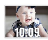
My Love Forerunner 920XT