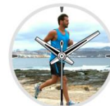
beat yesterday fenix 3 HR