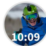
Snow Skiing fenix 3