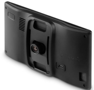
Kollisionswarner und Spurhalte-Assistent dank DashCam: Garmin DriveAssist

Garmin DriveAssist ist die neue Navi- und DashCam Lösung für Vielfahrer. Sie setzt auf Garmin DriveSmart auf. Die eingebaute Kamera nimmt das Verkehrsgeschehen durch die Windschutzscheibe auf und speichert die Daten im Falle einer Erschütterung, etwa bei einem Unfall, automatisch. Außerdem ermöglicht die DashCam Fahrassistenten-Features. Sie unterstützt Anwender mit dem Kollisionswarner und Spurhalte-Assistent und lotst sie besonders sicher durch den Straßenverkehr. Der neue „Go“-Alarm benachrichtigt Fahrer, wenn sich der Verkehr wieder in Bewegung setzt. Garmin DriveAssist ist künftig für 359,99 Euro (UVP) erhältlich.