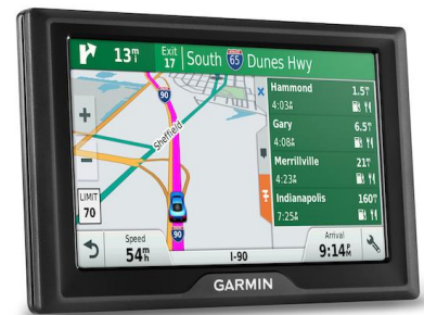
Neue PND-Serie: Garmin Drive

Garmin DriveSmart ist in drei Größen verfügbar. Das Modell verfügt über hilfreiche Features wie Verkehrsinformationen in Echtzeit via DAB+ und kann per Smartphone-Link auch andere Live-Dienste abrufen, zum Beispiel Informationen zum Wetter oder Benzinpreisen. DriveSmart fördert sicheres Fahrverhalten durch eine erweiterte sprachgesteuerte Navigation und eine verbesserte Bluetooth-Freisprechfunktion. Fahrer können Anrufe, Nachrichten und andere Smartphone-Benachrichtigungen über das Navi-