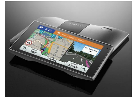
Überzeugt mit hochwertigem Design: Garmin DriveLuxe

Garmin DriveLuxe knüpft an die mehrfach mit einem Red Dot Award ausgezeichneten Premium-Geräte an und ist damit besonders für Design-Liebhaber attraktiv. Die Gestaltung des Premiumnavigationsgeräts überzeugt mit einem hochwertigen Metallgehäuse, dank magnetischen Aktivhalterung mit Ladefunktion stört kein Kabel den Blick auf die Windschutzscheibe. Garmin DriveLuxe ist künftig für 389,99 Euro (UVP) erhältlich.