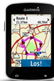
Neuer Profi-Radcomputer von Garmin: der Edge 820