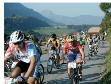
Garmin Bike Marathon Classics mit fünf Rennen