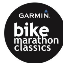
Logo der Garmin Bike Marathon Classics

Garmin entwickelt weltweit mobile Produkte für die Bereiche Automotive, Fitness & Outdoor, Marine und Aviation. Seit der Gründung 1989 hat Garmin mehr als 150 Millionen Produkte verkauft. Für das Unternehmen mit Hauptsitz in Schaffhausen, Schweiz arbeiten heute weltweit über 11.000 Mitarbeiter in 50 Niederlassungen. Garmin zeichnet sich durch eine konstante Diversifikation aus, dank derer Bereiche wie Fitness & Health Tracker, Smartwatches, Golf- und Laufuhren erfolgreich etabliert werden konnten. In der DACH-Region ist Garmin mit Büros in Garching bei München (D), Graz (A) und Schaffhausen (CH) vertreten. In Würzburg (D) wird außerdem ein eigener Forschungs- und Entwicklungsstandort unterhalten. Ein zentrales Erfolgsprinzip ist die vertikale Integration: Die Entwicklung vom Entwurf bis zum verkaufsfertigen Produkt sowie der Vertrieb verbleiben weitestgehend im Unternehmen. So kann Garmin höchste Qualitäts- und Designstandards garantieren und seinen Kunden für die verschiedensten Anwendungen maßgeschneiderte Produkte anbieten