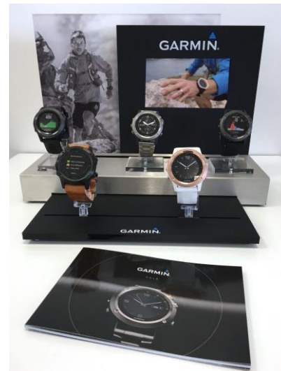
Die Garmin Watch-Kollektion

Garmin entwickelt weltweit mobile Produkte für die Bereiche Automotive, Fitness & Outdoor, Marine und Aviation. Seit der Gründung 1989 hat Garmin mehr als 150 Millionen Produkte verkauft. Für das Unternehmen mit Hauptsitz in Schaffhausen, Schweiz arbeiten heute weltweit über 11.000 Mitarbeiter in 50 Niederlassungen. Garmin zeichnet sich durch eine konstante Diversifikation aus, dank derer Bereiche wie Fitness & Health Tracker, Smartwatches, Golf- und Laufuhren erfolgreich etabliert werden konnten. In der DACH-Region ist Garmin mit Büros in Garching bei München (D), Graz (A) und Schaffhausen (CH) vertreten. In Würzburg (D) wird außerdem ein eigener Forschungs- und Entwicklungsstandort unterhalten. Ein zentrales Erfolgsprinzip ist die vertikale Integration: Die Entwicklung vom Entwurf bis zum verkaufsfertigen Produkt sowie der Vertrieb verbleiben weitestgehend im Unternehmen. So kann Garmin höchste Qualitäts- und Designstandards garantieren und seinen Kunden für die verschiedensten Anwendungen maßgeschneiderte Produkte anbieten