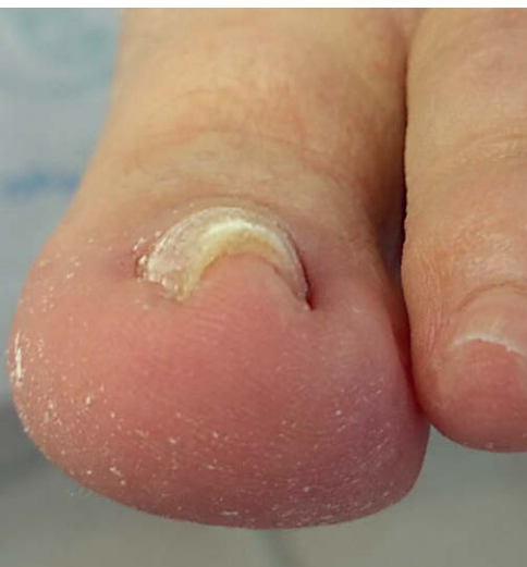
Der Großzehennagel ist extrem gerollt und die Nagelplatte verdickt.

Im Anschluss entfettete ich die beiden Großzehennägel mit dem GEHWOL Nail repair Cleaner, um die Spange dann an drei Punkten zu fixieren. Dafür eignet sich aus meiner Sicht das GEHWOL Nail repair Gel sehr gut. Um die Nägel zu säubern, griff ich noch einmal zum Cleaner. Zum Abschluss der Behandlung pflegte ich sie mit dem GEHWOL med Nagel- und Hautschutz-Spray. Das schützt vor Pilzbefall und versorgt die Nägel mit den hochwertigen Pflegesubstanzen Vitamin E, Clotrimazol, Panthenol und Bisabolol. Übrigens: Ich empfehle dies meinen Patienten gerne auch für die nachhaltige Pflege zu Hause.