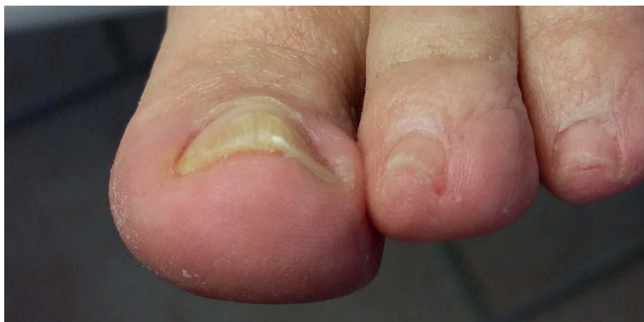
Nach Abschluss der Therapie war der Nagel meiner Patientin wieder normal gewölbt. Sie hatte keine Schmerzen mehr und war überglücklich über die Verbesserung.

Das neue Nagelkorrektursystem bringt schnellen Erfolg bei der Korrektur des Unguis incarnatus und Unguis convolutus. Alle Patienten sind begeistert, denen ich mit diesem Nagelkorrektursystem helfen konnte. Schon nach dem ersten Applizieren sehen Sie, wie der Nagel angehoben wird. Genau das wollten wir erreichen, als wir die Naspan®-Platinum entwickelt haben. Wir wollten zudem ein Korrektursystem, das im Fußpflegealltag leicht, schmerzfrei und zeitsparend anzuwenden ist.