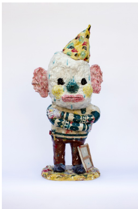
Sensitive Artist , 2015