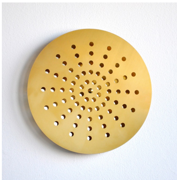
Golden Shower , 2011 Brass, mirror, 35 x 1 cm ©Kristina Matousch

På en performance på ansedda ISPC i New York förra året lät hon bakom en vägg steka två köttbullar i taget. När köttbullarna var färdigstekta kom de ut genom två hål i väggen.