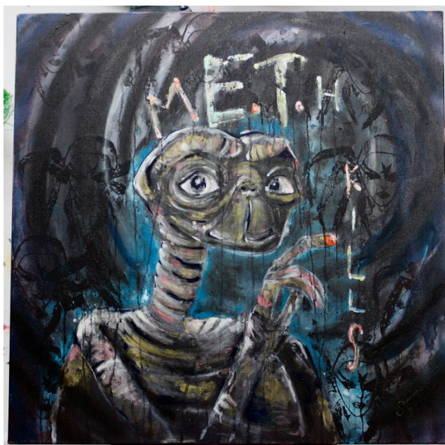
Meth Kills , 2013