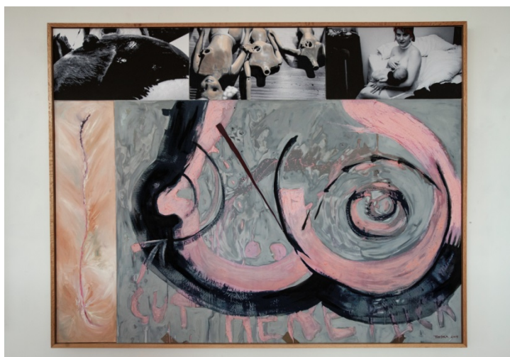
Cut Here 2, 2015 Oil and inkjet on canvas 207 x 161 cm