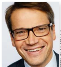
Göran Hägglund Socialminister

Läkemedelsriksdagen arrangeras av Läkemedelsakademien. Dagen genomförs med föredrag och paneldebatter.