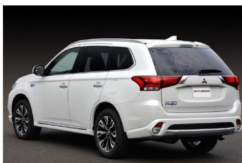
Outlander Plug-In Hybrid