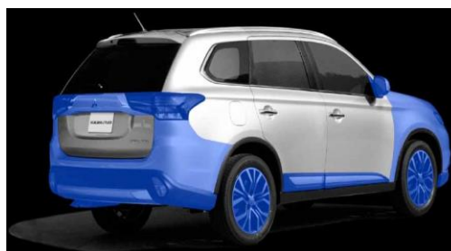
Förändringar som är genomförda från tidigare modell

Nya Outlander är 40 mm längre (4 695 mm), slimmad, mer solid och med en ytterligare förbättrad komfort än sin föregångare, vilket är ett resultat av de europeiska kundernas återkoppling.