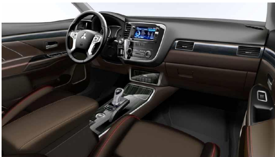
Outlander Plug-In Hybrid