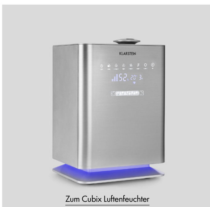
Zum Cubix Luftbefeuchter