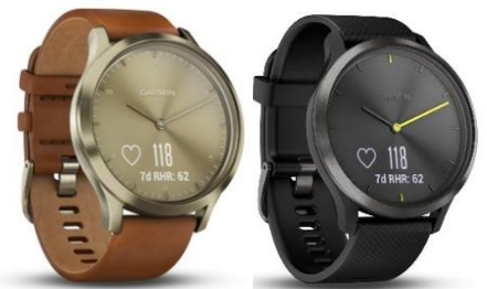
Die vívomove HR im klassischen Uhrendesign mit digitalen Akzenten.