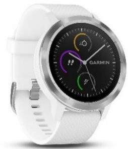
Die GPS-Uhr von Garmin bietet smarten Alltagsfeatures, wie das neue Bezahlssystem Garmin Pay™ ready

Schwarz/Schwarz (mit pulverbeschichteter Lünette); CHF 399.00