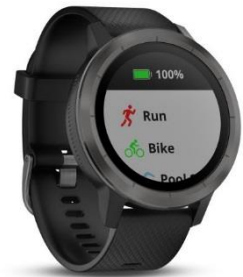
Zahlreiche vorinstallierte Sportprofile unterstützen jedes Training