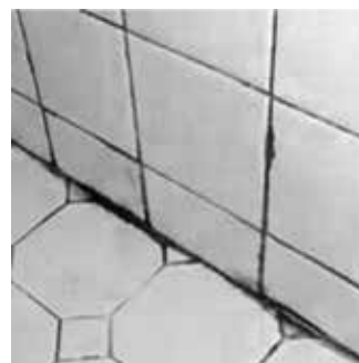
Fuktskador i badrum är ofta dyra och tar lång tid att åtgärda med den traditionella renoveringsmetoden.