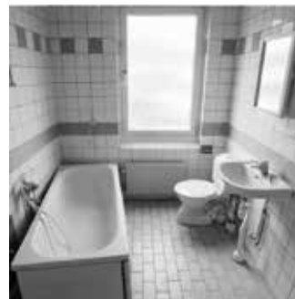
Bristande tätskikt bakom kakel, våtrumsmatta eller färg är vanligt förekommande i äldre flerbostadshus.

För att renovera badrummen i rätt kvalitet och till rätt pris är det en fördel om du som fastighetsägare använder "insidan".