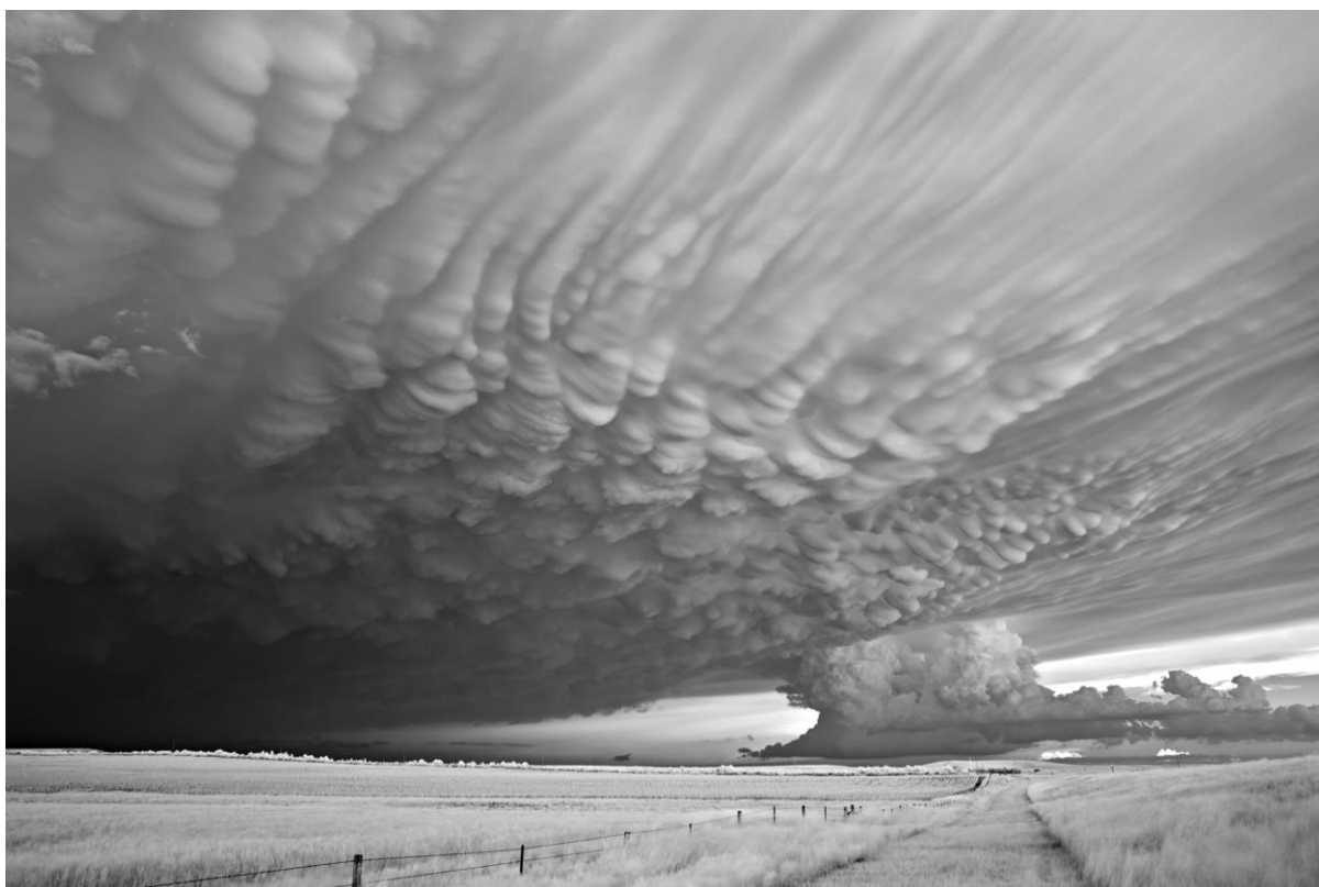
Mitch Dobrowner, Professional, Natural World & Wildlife (2018 Professional competition), 2nd Place, 2018, Sony World Photography Awards