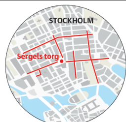
På de rödmarkerade gatorna får studentflaken inte köra.

Onsdagen den 5 juni bör den som kan undvika att röra sig på stan, framför allt är det klokt att lämna bilen hemma. Den dagen har nästan hälften av alla gymnasieskolor i Stockholms stad utspring.