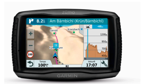
Garmin Touren Routing verspricht mehr Spaß am Fahren mit dem zūmo 595LM Modell.

Garmin entwickelt weltweit mobile Produkte für die Bereiche Automotive, Fitness & Outdoor, Marine und Aviation. Seit der Gründung 1989 hat Garmin mehr als 150 Millionen Produkte verkauft. Für das Unternehmen mit Hauptsitz in Schaffhausen, Schweiz arbeiten heute weltweit über 11.000 Mitarbeiter in 50 Niederlassungen. Garmin zeichnet sich durch eine konstante Diversifikation aus, dank derer Bereiche wie Fitness & Health Tracker, Smartwatches, Golf- und Laufuhren erfolgreich etabliert werden konnten. In der DACH-Region ist Garmin mit Büros in Garching bei München (D), Graz (A) und Schaffhausen (CH) vertreten. In Würzburg (D) wird außerdem ein eigener Forschungs- und Entwicklungsstandort unterhalten. Ein zentrales Erfolgsprinzip ist die vertikale Integration: Die Entwicklung vom Entwurf bis zum verkaufsfertigen Produkt sowie der Vertrieb verbleiben weitestgehend im Unternehmen. So kann Garmin höchste Qualitäts- und Designstandards garantieren und seinen Kunden für die verschiedensten Anwendungen maßgeschneiderte Produkte anbieten.