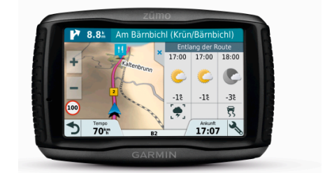
zūmo 595LM: Mit Smart Notifications auch unterwegs immer in Verbindung bleiben.