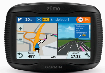
Mehr Freiheit beim Fahren: Das zūmo 395LM Modell mit lebenslangen Karten-Updates und Musikstreaming-Option.

München, 16. Februar 2016 – Pünktlich zum Beginn der neuen Motorradsaison präsentiert Garmin seine neuen zūmo 345LM, 395LM und 595LM Motorrad-Navis. Besonderes Highlight: Mit dem Garmin Touren Routing gehören lange, monotone Strecken der Vergangenheit an. Genuss-Biker können sich eine individuelle, reizvolle Streckenplanung entwerfen lassen, die ganz nach ihrem Geschmack ist. Egal, wie kurvenreich oder bergig es werden soll, das Touren Routing findet in wenigen Handgriffen eine passende Strecke, wobei Autobahnen oder besonders gleichmäßige Straßen auf Wunsch vermieden werden.