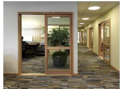
Ny glasskydedørsparti op til R_w 37 dB.