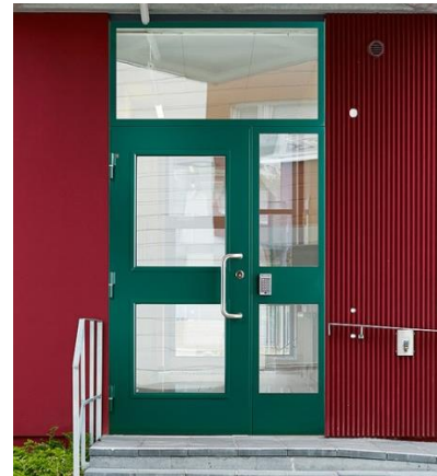
YEP66 – nyudviklet entréparti i stål.