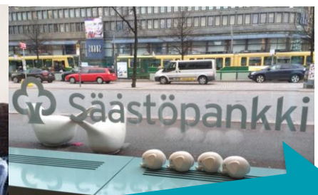
Säästäväisyyden edistäminen kirjattu säästö- pankkilakiin