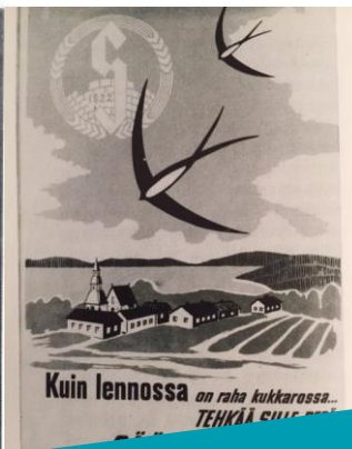
Perustettiin vähävaraisia varten, opetti säästäväisyyttä