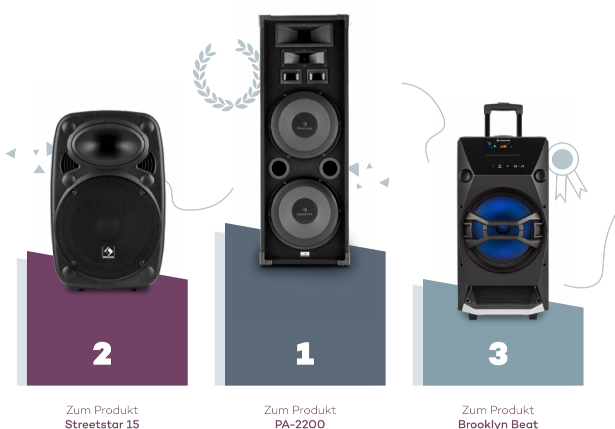
Zum Produkt Streetstar 15