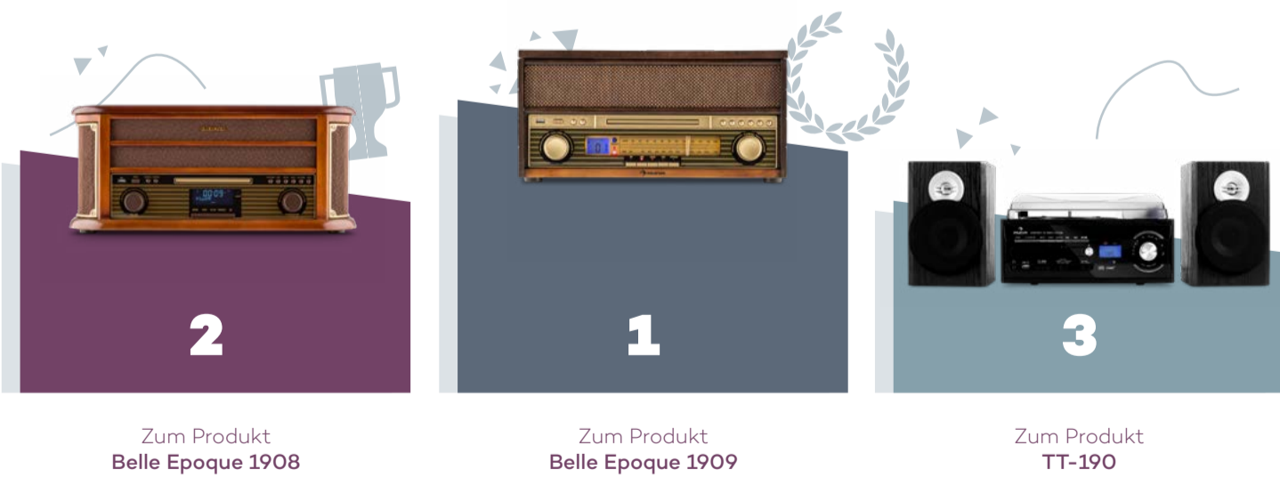
Zum Produkt Belle Epoque 1908