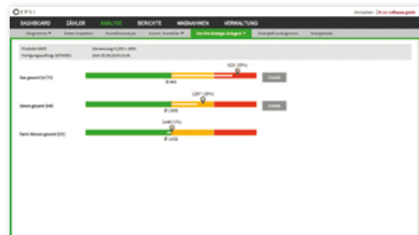
Überwachung der aktuellen Energiewerte: Auf einen Blick lässt sich der Fertigungsprozess energetisch bewerten.