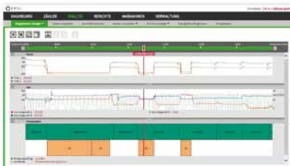
Lastgänge und Energieverbrauchskurven – übersichtlich kombiniert mit den entsprechenden Fertigungsdaten.

Dadurch werden die Maschinensignale und Prozessdaten für die Software nutzbar. Wichtige Fertigungsdaten wie die bearbeiteten Aufträge, die Zeiten, die Qualität und das Material fließen somit in die Betrachtung ein.