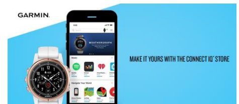
Connect IQ Store

Garmin a récemment lancé Connect IQ 3.1, la dernière édition de sa plateforme ouverte, destinée aux développeurs. Au total Connect IQ est disponible sur plus de 50 produits Garmin.