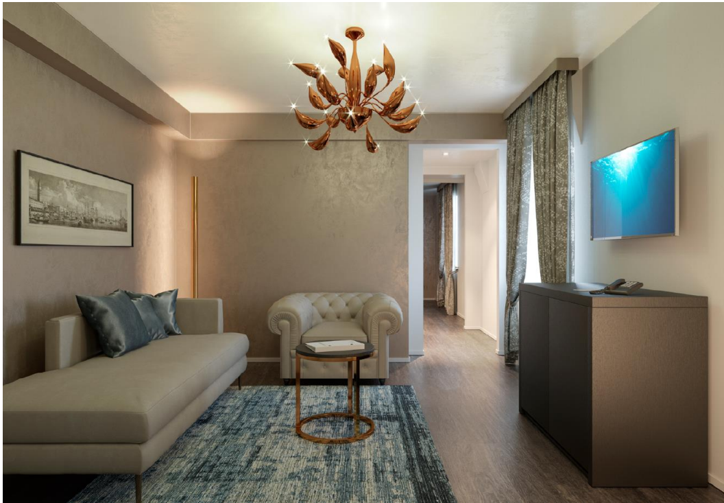
Die Zimmer und Apartments sind in edlen und warmen Farbtönen gehalten