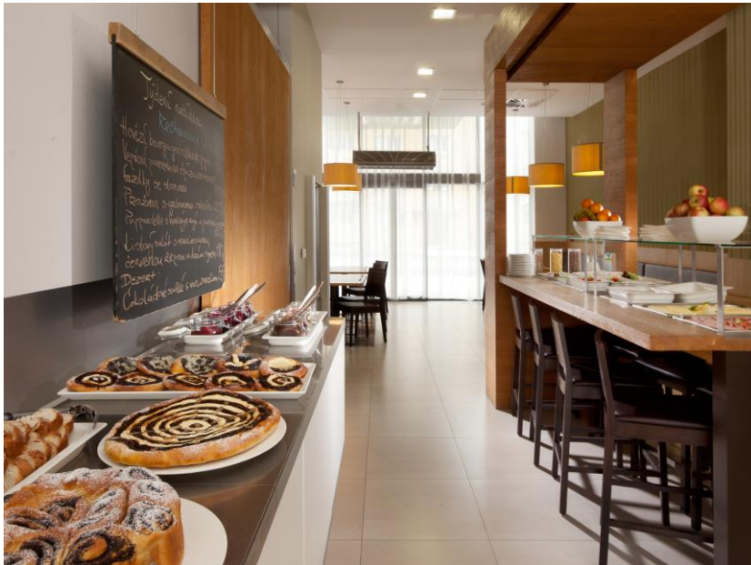
Der Frühstücksbereich im Comfort Hotel Olomouc Centre.