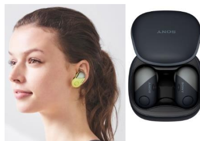
Безжични шумопотискащи стерео слушалки WF-SP700N

Безжичните шумопотискащи стерео слушалки WF-SP700N осигуряват несравнимо качество на звука за хората с активен начин на живот и се отличават с първата в света 4 шумопотискаща и устойчива на напръскване (IPX4) 5 функционалност сред напълно безжичните слушалки. Вече може изцяло да фокусирате вниманието си върху спорта или упражненията, които правите, и да се наслаждавате на любимата си музика, без да се притеснявате от външни фактори като шум, потене или дъжд. Режимът Ambient Sound ви позволява да чувате околни звуци, докато тренирате, и да слушате музика. Наред с тях бе обявен и моделът WI-SP600N като спортно-ориентирано предложение в категорията слушалки с лента зад врата.