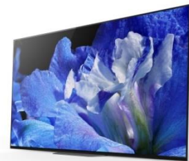
Серията AF8 4K OLED BRAVIA® телевизори

Новата серия 4K OLED телевизори BRAVIA® AF8 е оборудвана с 4K HDR процесор за изображения X1™ Extreme, съчетан с уникалната технология Acoustic Surface™ на Sony, която позволява на звука да излиза директно от екрана на телевизора и беше използвана в известната серия A1, представена през изминалата година. AF8 допълват линията 4K OLED BRAVIA телевизори с нов дизайн, който намалява пространството заемано от устройството, позволявайки телевизорите от тази серия да бъдат разполагани на много повече места в помещението. Те осигуряват завладяваща и хармонична интеграция на картина и звук, каквато само Sony може да предложи.