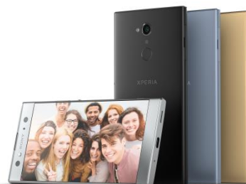
Xperia XA2 Ultra

Xperia XA2 предлага 23MP основна камера с висока резолюция, способна да заснема 4K видео с максимална ISO чувствителност от 12800 (за снимки), както и 8MP предна камера със 120-градусов свръх широк ъгъл на заснемане. Xperia XA2 Ultra разполага със същата 23MP основна камера като Xperia XA2, както и с двойна предна селфи камера, състояща се от 16MP камера с оптична стабилизация на изображението и 8MP камера със 120-градусов свръх широк ъгъл на заснемане.