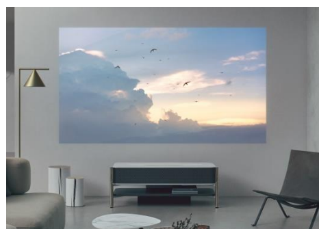
Проектор с ултра къс фокус LSPX-A1

Продуктите Life Space UX ви дават силата да трансформирате пространството около себе си и да създавате нови изживявания. Новият 4K проектор с ултра къс фокус LSPX-A1 ще бъде пуснат на пазара в САЩ през пролетта на 2018 г. Проектиран, за да се вписва навсякъде – с капак от изкуствен мрамор, алуминиева рамка с полуогледално покритие и дървена лавица, проекторът се съчетава добре с всяка домашна среда. С вградените цифрови технологии за изображения може да се наслаждавате на 4K HDR проекции с размер до 120 инча, просто поставяйки го близо до стена, а неговия съвместим с Advanced Vertical Drive Technology 11 високоговорител издава звук, резониращ из цялото пространство. Например, можете да трансформирате своето лично пространство, като проектирате изображения на гора върху стената и слушате ромоленето на поток. Моделът разполага и със суббуфери за завладяващо аудио изживяване, докато се наслаждавате на любимия си филм.