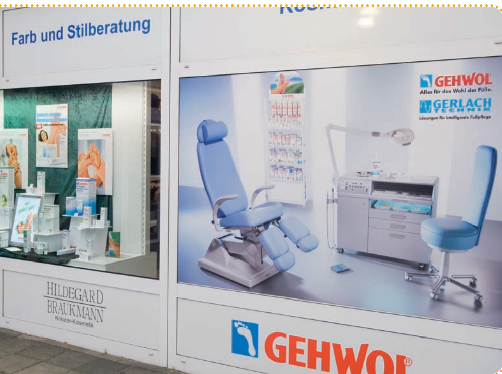
Seit dem Start der Fußpflegeserie FUSSKRAFT-Serie im Jahr 1961 ist die Fußpflegepraxis Knop (Bild links) davon überzeugt. Thomas Knop, der die heute modernisierte Praxis (Bild rechts) übernommen hat, bleibt dieser Tradition treu.

Meeresalgen verbessern den Feuchtigkeitsgehalt der Haut spürbar. Vitamin E schützt die Hautzellen und wirkt der vorzeitigen Hautalterung entgegen. Allantoin, ein Wirkstoff der Rosskastanie, glättet zudem die Haut und beschleunigt Ihre Regeneration.